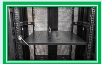
Puerta Posterior Doble