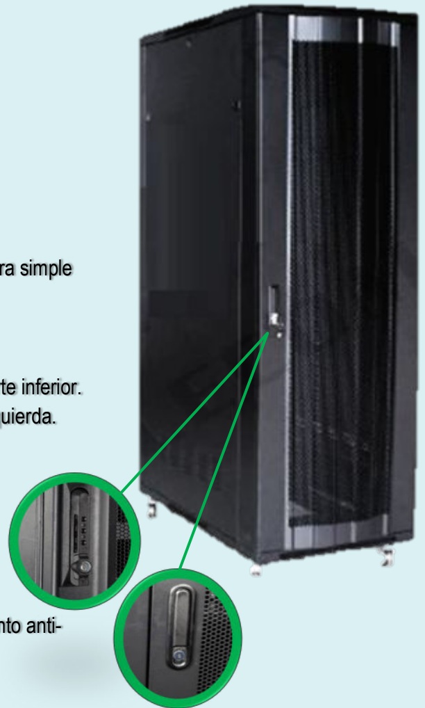
Manija Simple y con Clave